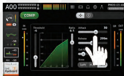
schermata es. di Dynamics

Grazie a questa forte implementazione, molte delle operazioni più comuni possono essere eseguite dal solo utilizzo del touch screen, questo ha permesso un rinnovamento e ottimizzazione della già collaudata e immediata superficie di controllo tipica Yamaha. Inoltre i mixer TF offrono tutta una serie di library preset sia per i canali di ingresso (HA Gain, EQ, Dynamics, Bus Assign, Channel Name, Color Bar) che per i canali di uscita (EQ, Dynamics), agevolando così l'utente nella preparazione del setup live.