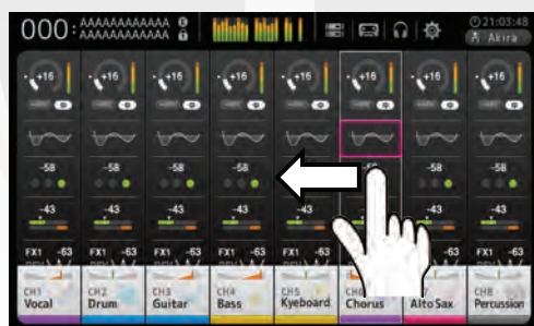
scorrimento pagine come su tablet

Con la nuova linea di mixer digitali TF Series, Yamaha completa un percorso di rinnovamento prodotti partito nel 2012 con la serie CL, a cui sono seguiti i fratellini QL5 e QL1, e la giovanissima ammiraglia PM10 Rivage lanciata a Tokyo nel Novembre 2014 e presente anche a questo ProLight + Sound 2015 di Francoforte. Per Yamaha la serie TF rappresenta la prossima generazione di console intelligenti dedicate al mondo del live. La sigla TF sta a significare “Touch & Flow” e questo ci viene subito trasmesso dal suo avanzatissimo schermo multi touch (unico nella sua fascia di prezzo) da 7 pollici che ci garantisce velocità e intuitività.