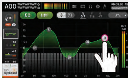
modifica parametri tramite drag & drop