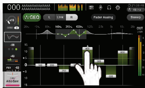
schermata es. di GEQ