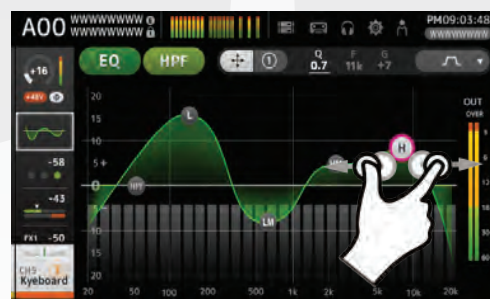
modifica Q tramite multi touch