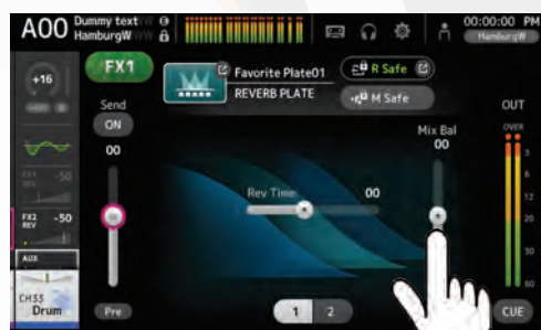
schermata es. di EFX